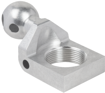
Держатель для пружинных плунжеров HT-FST