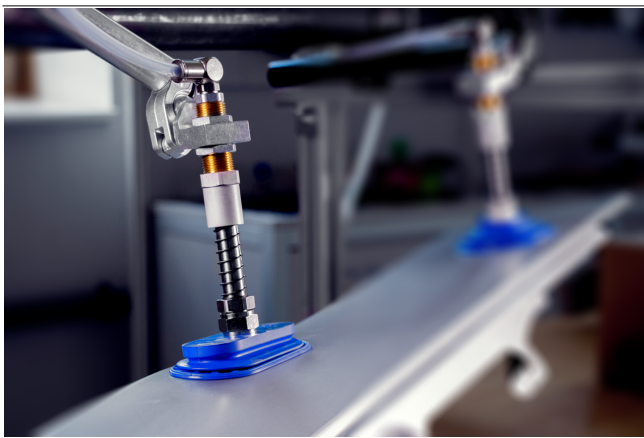
Держатели для пружинных штифтов HT-FST в сочетании с пружинными штифтами FSTE-HDB при обращении с деталями из листового металла